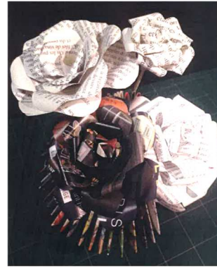
Fleur type rose