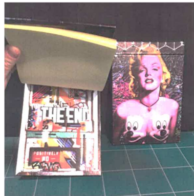
Petits carnets en reliure japonaise