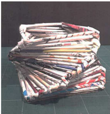
Pot à crayon